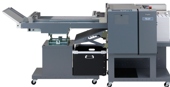
Agregue el transportador largo opcional para manejar el apilado de trabajos de alto volumen