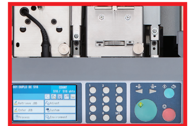
El panel de control fácil de usar ofrece una memoria de 250 trabajos