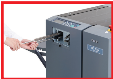
Los módulos de doble plegado son intercambiable y fácil de cambiar