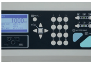
PANEL DE CONTROL. Amigable al usuario (el panel de control simplifica la operación).

La DP-G310 es tan fácil de usar como una copiadora, desde la programación de un trabajo en el panel de control hasta el reemplazamiento de cartuchos de tinta y rollos de master. La limpieza y eliminación del master usado, también es fácil de hacer a través el sistema automático patentado de disposición del master, agregando la interfase opcional USB, los usuarios pueden ajustar la calidad de imagen y enviar trabajos de dos colores directamente a la duplicadora desde su propia computadora.