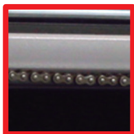
Estructura giratoria de cadena (Funcionamiento suave y sin retardo)