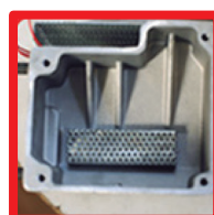
Dispositivo de filtro de cola (Evita el bloqueo del depósito de cola)