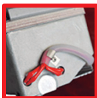
Doble tubo de calentamiento (Aumento rápido de la temperatura)