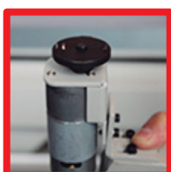
Fresa de aleación (Ranuras de encolado profundo y mejor calidad de encolado)