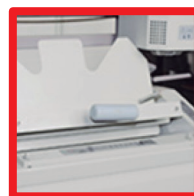
Dispositivo de sujeción automático