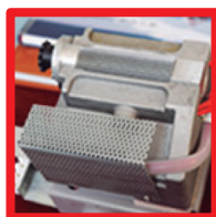
Estructura de encolado sectorial. Encolado uniforme