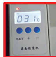
Control digital de temperatura (Alta precisión, temperatura estable)