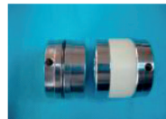
3) Módulo de Perforado