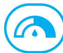
CALENTADORES INTELIGENTES MIMAKI