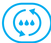
SISTEMA DE SUMINISTRO DE TINTA ININTERRUMPIDO