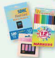
terminados y listos para exhibir