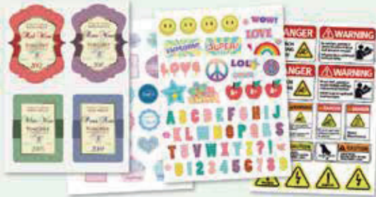
Hojas impresas de 330.2 x 482.6 mm (13" x 19")