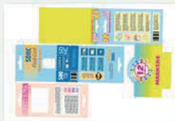
Hojas impresas de 330.2 x 482.6 mm (13" x 19")