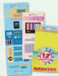
con productos minoristas