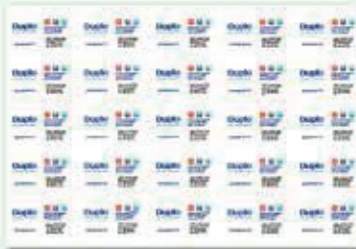
Hojas impresas de 330.2 x 482.6 mm (13" x 19")